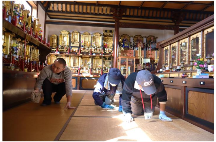
洞雲院様(文下) 本堂の掃除