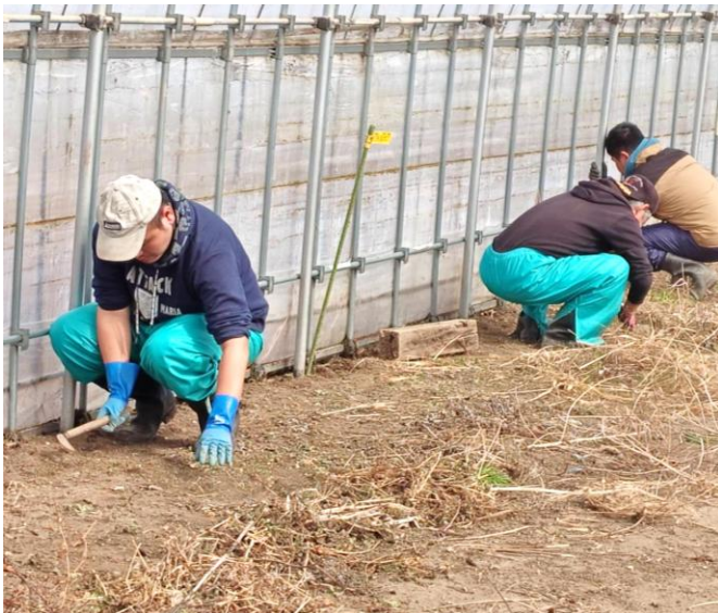
農事組合法人庄内おばに農場様より受注