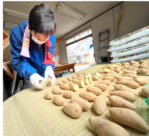
じゃがいもの芽出し

雪が溶け、今年も我老林と桜新町に畑を借り、「ひので」のうえんが始まりました。たくさん作物を育て、販売する予定です。