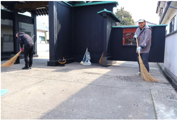
総穂寺様(陽光町) 境内のはき掃除

鶴岡市内のお寺さんより境内や本堂などの掃除の仕事をいただき、隅々まできれいにしました。