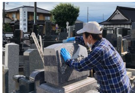
苗津町の法林寺様でお墓の掃除

春になり、外仕事のシーズンがやってきました。農家さんの手伝い以外の仕事も募集しています。ご連絡ください。