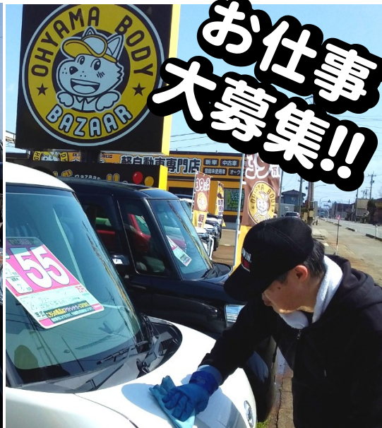
大山のた山ボデー様で車の洗車

春になり、外仕事のシーズンがやってきました。農家さんの手伝い以外の仕事も募集しています。ご連絡ください。