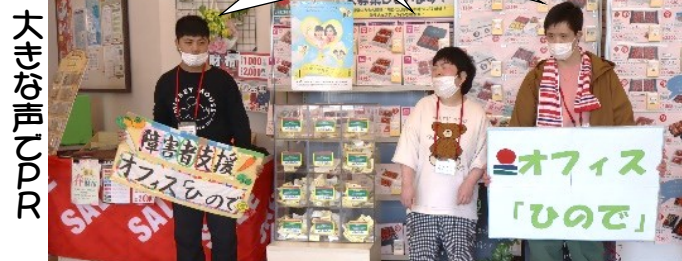
マックスバリュ鶴岡南店のみ設置されております

ハンガーかけの現場にくる利用者の元気な挨拶が嬉しく、従業員共々温かい気持ちでお仕事している様子を見守っています。ドビーたたみも、一生懸命にたくさんの量ができるのでとても助かっています。