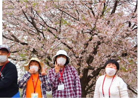
16日 鶴岡市馬渡桜づつみ