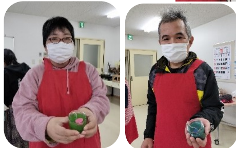
私達が作ったキャンドル

11月17日「くるりん館」で開催された使用済みの油を使ったエコキャンドル作りに参加してきました。この研修を活かして販売できる様に取り組んでいきます。