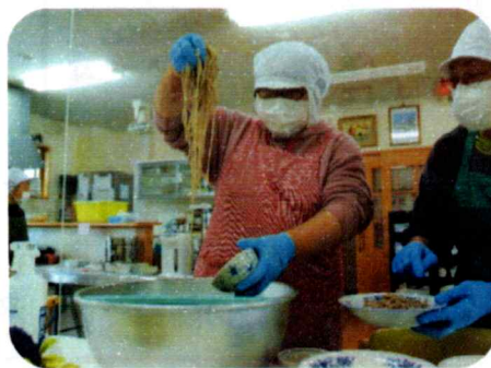
茹でたおそばを盛り付けています