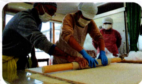
麺棒を使い伸ばしています