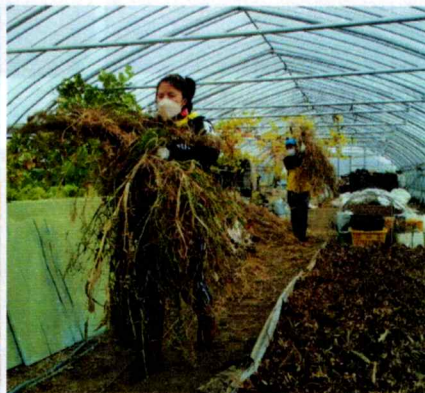
カブを育てた後の除草