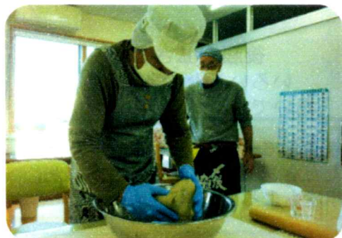
力を込めてこねています