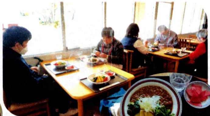
11月17日 ノウフク野菜のジャージャー麺 小鉢付