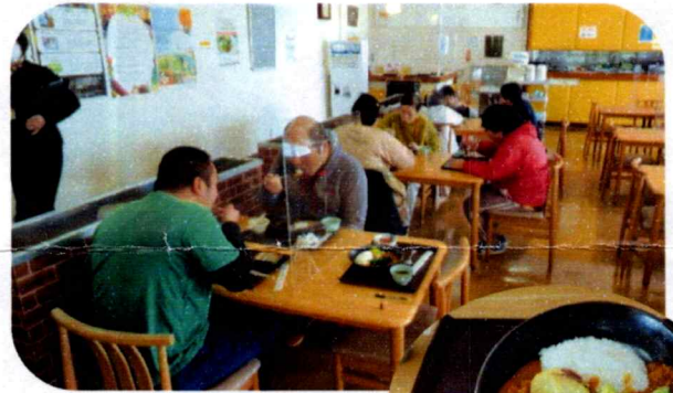
11月15日 秋野菜のノウフクバターチキンカレー

次回の開催予定は1月。「ひので」からは干し柿、ズイキガラを食材として提供いたします。