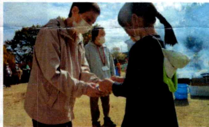
園児さんからアツアツの焼き芋を受け取りました