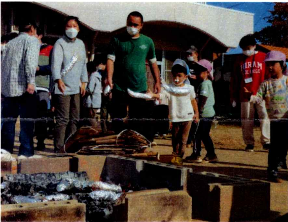
皆で焚き火にサツマイモを入れたよ