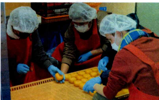
皮むきをした柿をトレイに並べて、乾燥機に入れます