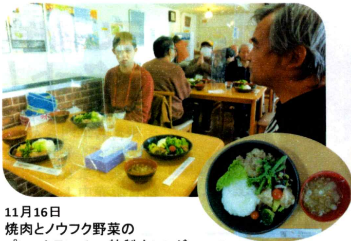
11月16日 焼肉とノウフク野菜のプレートランチ～特製オレンジソース～