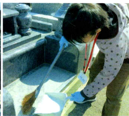
鶴岡市東原町の法林寺