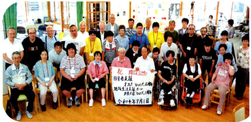
鶴岡福祉村の理事や家族の方々との記念撮影

7月1日鶴岡福祉村の理事の方々、家族の方々等と開設記念祝賀会を開催しました。支えてくださったご家族、地域の方々、ボランティアの方々のおかげと利用者・職員一同大変感謝しております。これからも皆色々な事に挑戦していきます。応援よろしくお祈りします。