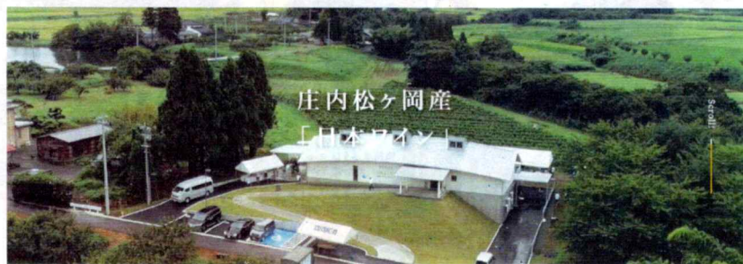
庄内松ヶ岡産 「日本ワイン」

羽黒町のエルサンワイナリー松ヶ岡(株)でワインの原料になるぶどうの葉取りと、レインカットのクリップ留めをしています。