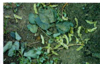
カラスに 食べられた枝豆

7月中旬に収穫を予定していた「ひので」農園の枝豆とカラトリイモがカラスの被害に遭い全滅しました。販売し工賃に反映させる事が出来ない状況になってしまいとても残念です。