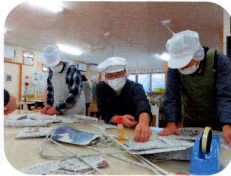
↑エコバック製作中