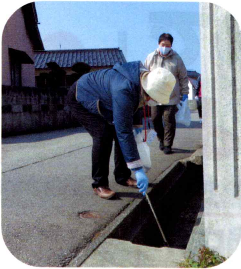
側溝の中のごみも拾いました

3月9、11日オフィス「ひので」周辺から少し足を延ばして赤川の河川敷まで行き美化活動を行いました。日出町内がきれいになってよかったです。また行いたいと思います。