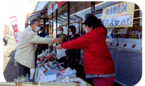
↑いらっしゃいませ