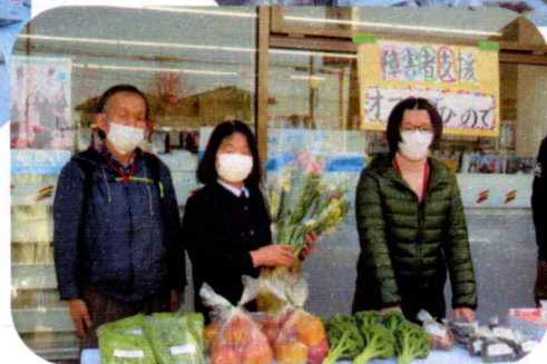
↑ご購入上げありがとうございます。