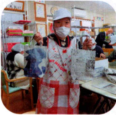
↑こんなエコバッグを作っています

新聞紙でエコバッグ作りをするための英字新聞を寄付してください。環境保護のために使いたいと思います。よろしくお願ひします。