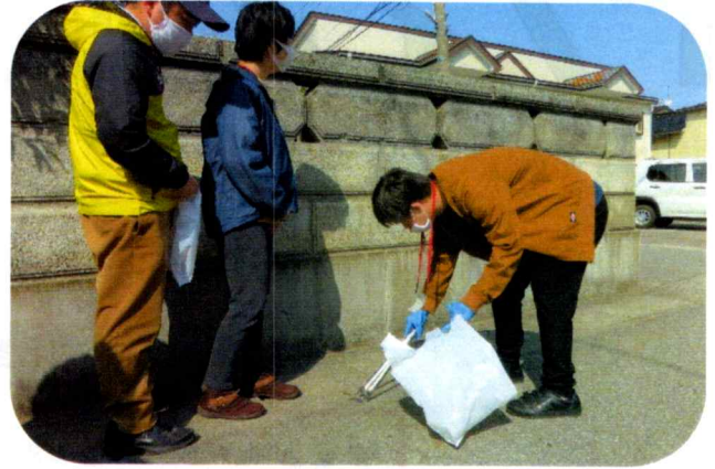
↑きれいになったよ

3月9、11日オフィス「ひので」周辺から少し足を延ばして赤川の河川敷まで行き美化活動を行いました。日出町内がきれいになってよかったです。また行いたいと思います。